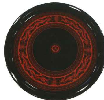
きんま塗り丸盆 (高松)