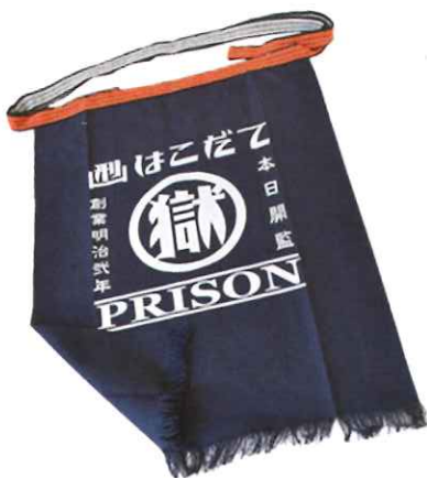
大人気！ 函館のマル獄シリーズ