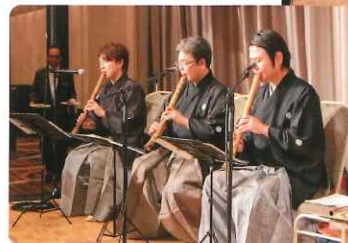
懇親会に華を添える 和楽器オーケストラ あいおい