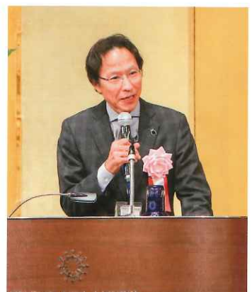
記念講演 姜 尚中 先生