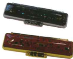
津軽塗印鑑ケース (青森)