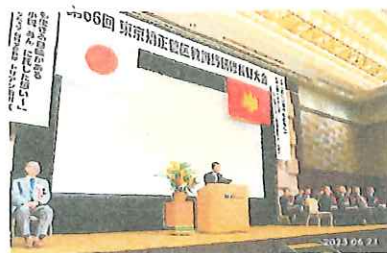
5 矯正局長あいさつ (代理)