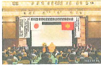
4 開会のことば (大勸進)